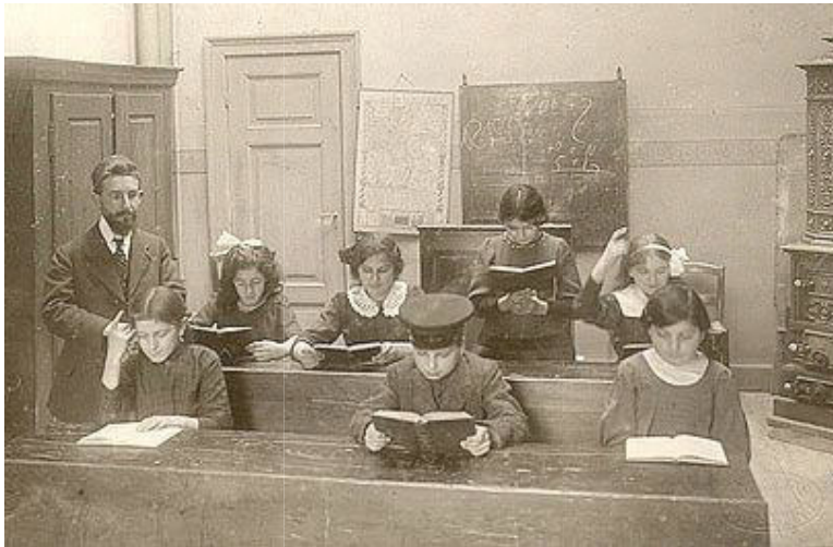
Le Talmud Torah

Le nouvel oratoire fut aménagé rue des Cordonniers donnant sur la Grand'rue, en 1884. Mais rapidement ce local devint trop petit.