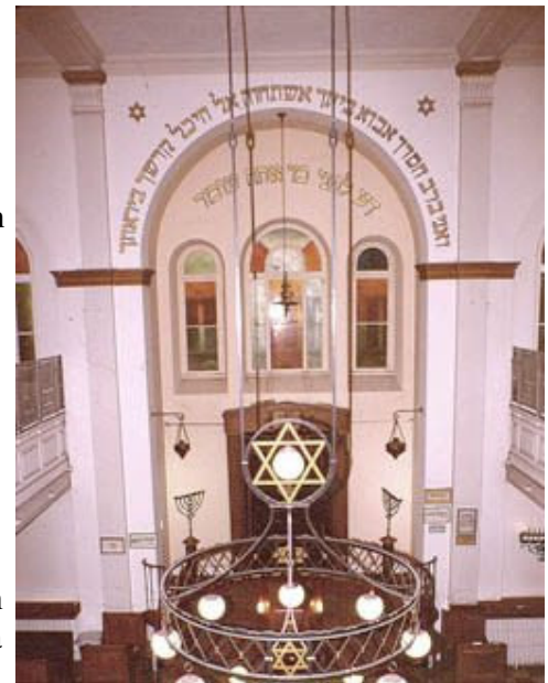
Intérieur de la synagogue, © M. Rothé

Le transfert de cette maison de prières et d'études rue Turenne est le choix de la communauté vivante sur celui des pierres