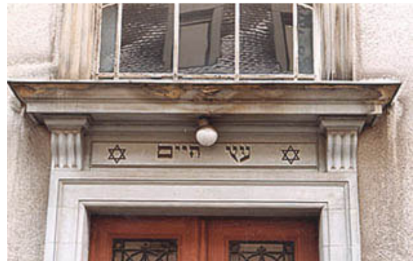
Fronton de la synagogue, © M. Rothé