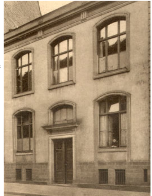
Extérieur de la synagogue, photographié sur la plaquette ci-dessus