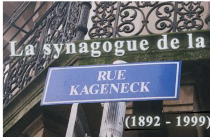
par Jean Daltroff

Extrait de l'Almanach du KKL-Strasbourg 5760-2000 (avec l'aimable autorisation des éditeurs)